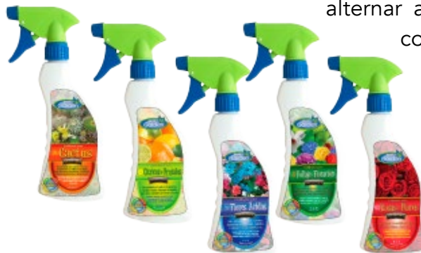
Fertilizantes Líquidos Específicos

4. Fertilizantes Líquidos Específicos para; Cactus, Flores Ácidas, Rosas y Cítricos y Frutales. Tal como en el caso de los fertilizantes específicos granulares, existen los fertilizantes líquidos específicos. En éstos, los nutrientes requeridos por familias particulares de plantas, están disponibles de manera líquida, justamente para facilitar la rápida nutrición vegetal y así corregir eventuales deficiencias de las plantas. Para conseguir óptimos resultados se recomienda