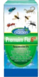
Insecticida Premium Flo

Hay varias alternativas para matar a las Arañas de Ricón. Alacranes, Moscas, Zancudos, Cucarachas, Hormigas, Polillas, Garrapatas entre muchas otras variedades de insectos desagradables y peligrosos tanto para la salud ambiental como para la vida humana. Hasta el momento todos son de origen químico y requieren ser manipulados por personas adultas responsables.