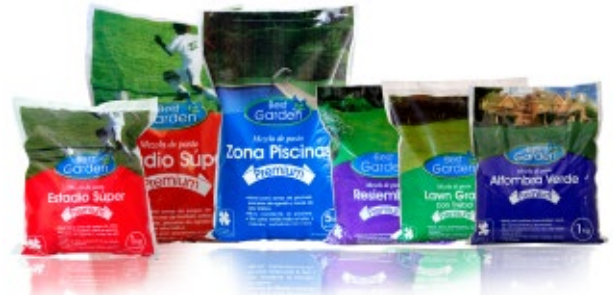
Mezclas de Pastos de BestGarden Estadio Súper Lawngress con Trébol Zona Piscinas y Alfombra Verde

esta presente en cada bolsa semillas utilizadas en la selección especial de otras cosas el porcentaje de pureza.