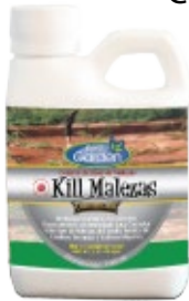
Herbicida No Selectivo Kill Malezas

Al igual que los caracoles, las malezas están siempre presentes en el jardín. Transportadas por los pájaros, las maquinas de cortar pasto o simplemente el aire van a estar siempre presentes en el jardín. Para combatirlas hay que usar un herbicida de amplio espectro como Kill Malezas , el cual al entrar en contacto con las malezas, le produce a estas el corte del suministro de agua. Por tal motivo que a las pocas horas las malezas se empiezan a secar. Dependiendo del tipo de malezas que se quiere controlar, el herbicida puede demorarse en actuar entre 24 y 72 horas de ser aplicado. Es importante advertir que Kill Malezas mata todo lo que toca, por eso es importante leer detenidamente las instrucciones de la etiqueta para saber como se debe aplicar.