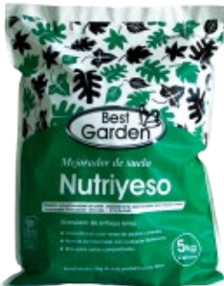
Mejorador de Suelo NutriYeso

El Humus de Lombriz aporta gran cantidad de materia orgánica, 100% natural proveniente de la transformación que hace la Lombriz de los residuos que el ser humano desecha, como cascara de frutas, hojas de verduras y residuos de alimentos vegetales.