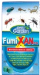
Insecticida Fumígeno FumiXan Pro

CiperPoint es un insecticida líquido de amplio espectro de acción. Con él se logra un efecto rápido casi inmediato sobre el insecto y su actividad permanece por unos 15 días, dependiendo de las condiciones de aseo y medioambientales. Al igual que el anteriormente indicado, Premium Flo pertenece a la misma familia de insecticidas líquidos, sin embargo, éste forma una película muy fina que se adhiere a la superficie y permanece activa por alrededor de 45 días. Su efecto de volteo o knock-down también es muy rápido.