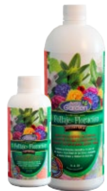
Follaje & Floración

3.! Fertilizantes Líquidos. Han sido desarrollados para aplicarlos como complemento a los fertilizantes genéricos o específicos. Su efecto sobre las plantas es rápido y su efecto residual es más corto que el de los fertilizantes solidos. De esta manera, se recomienda primero aplicar un fertilizante liquido para luego seguir con un fertilizante granular. Este último comienza a hacer efecto justo cuando el efecto del fertilizante liquido empieza a desaparecer.