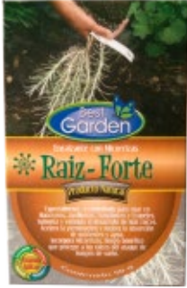
Enraizante Natural Raíz-Forte

Raíz-Forte, es un enraizante natural que ayuda a generar más raíces y raicillas a la planta. A diferencia de otros enraizantes éste contiene Micorrizas, hongos benéficos que protegen a la raíz del ataque de hongos de suelos.