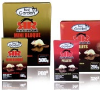
Ratador Pellet y Mini Bloque

Las ratas, lauchas y guarenes están presentes en todos los ambientes donde existe agua y alimentos. Son grandes "Gourmet" les gusta comer bien, por lo que lo atractivo y palatable que resulte el raticida, es lo que marca la diferencia entre uno y otro. Otro aspecto importante de tener presente es que siempre andan en familia, nunca solos. Su estrategia para distinguir entre un alimento y veneno, es mandar al miembro de la familia más viejo a probar el "alimento". Después de observarlo por 3 a 4 días deciden si comer o no el mismo alimento. Es por esta razón que los raticidas nunca hacen efecto inmediato, sino que lo hacen a contar del 5° día en adelante, para