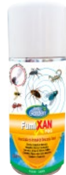
Insecticida Aerosol FumiXan Fog

Importante: Todos los insecticidas actúan por contacto, de ahí su importancia de aplicarlos por donde habitualmente se encuentran o andan los insectos.