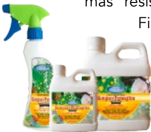
Hongos & Fumagina

Finalmente por su origen vegetal, no son tóxicos para las plantas ni para los seres humanos, contribuyendo eficientemente al cuidado y mantención del medio ambiente.